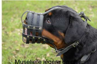
Museliere légère en cuir