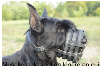
Museliere de version légère en cuir