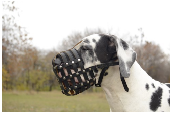
Museliere pour chien en cuir